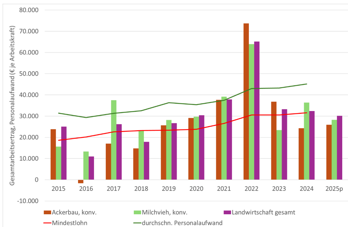
Abbildung 2: Gesamtarbeitsersertrag je Arbeitskraft in Ackerbau- und Milchviehbetrieben