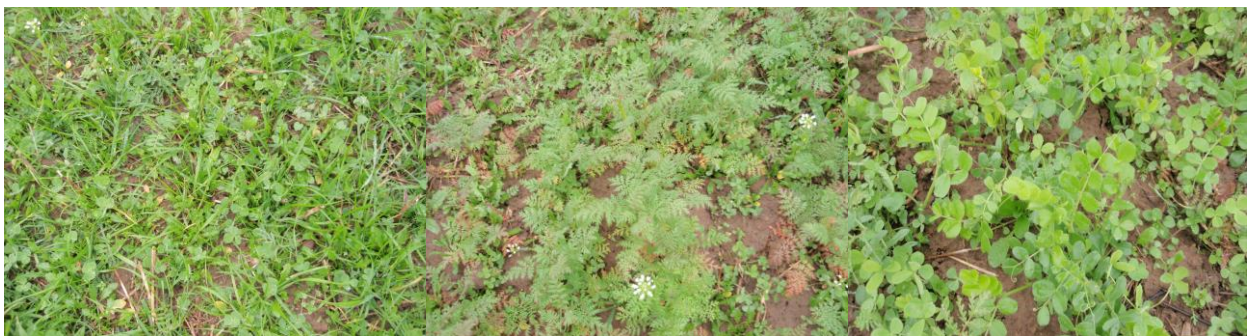
Zwischenfruchtgemenge v. l. n. r.: 100 % Überwinterung, teilweise abfrierend, 100 % abfrierend

Abfrierende Arten eignen sich besonders für eine anschließende Mulchsaat, allerdings können bei üppigen, frühzeitig abgefrorenen Beständen über Winter auch Nährstoffverluste auftreten.