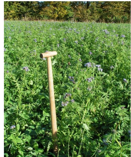
Abb. 1: Konkurrenzstarker Pflanzenbestand nach früher Aussaat mit hoher Nährstoffaufnahme

Die Anzahl der zur Verfügung stehenden Vegetationstage und die Temperatursumme begrenzen das Wachstum. Eine frühzeitige Aussaat sichert deshalb einen zügigen Auflauf und eine kräftige Jugendentwicklung. Bei einer Saat nach Getreide stellen dazu große und noch nicht verrottete Strohmenge hohe Anforderungen an die Aussaattechnik. Aus diesem Grund ist auch vor einer Zwischenfrucht eine ausreichende Durchmischung des Strohs Voraussetzung für den gleichmäßigen Auflauf. Strohschichten führen außerdem durch das weite C:N Verhältnis zu einer Immobilisierung von Stickstoff.