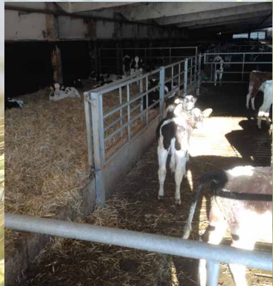
Gewöhnung an Spaltenboden