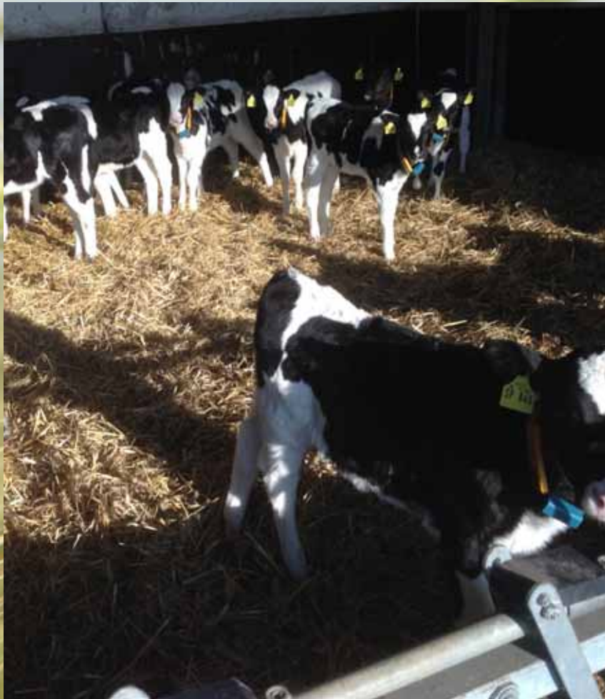
Kälberhaltung mit Automatenfütterung