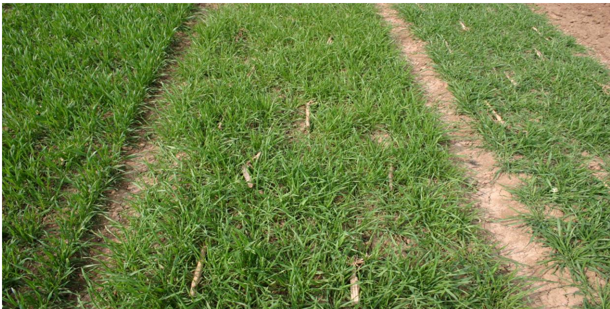
Abbildung 1: Infektion von Wintertriticaleversuchen mit Maisstoppeln

In den Versuchen von 2003 bis 2013 wurden Triticalesorten mit größerer Anbaubedeutung sowie zur Zulassung anstehende Wertprüfungsstämme in mehreren Jahren und an mehreren Orten mit mindestens 2 Wiederholungen in Feldversuchen geprüft. Zumeist kam nur ein frühes Fungizid zur Mehлтаubekämpfung in diesen Versuchen zum Einsatz. Die Versuchsdurchführung erfolgte in Anlehnung an die „Richtlinien zur Durchführung von Wertprüfungen und Sortenversuchen“ des Bundessortenamtes. Die Versuchsorte lagen in den beteiligten Bundesländern zumeist auf Löss-Standorten. Die Versuchsflächen wurden mit Maisstoppeln kontaminiert, um Maisvorfrucht zu imitieren. Das Einstreuen des Infektionsmaterials, das von vorjährigen Maisschlägen stammte, erfolgte zu Vegetationsbeginn gleichmäßig in die Versuchsparzellen (Abb. 1). Am Erntegut wurde der DON-Gehalt der einzelnen Prüfglieder mit Hilfe des ELISA-Tests (Thüringen, Sachsen, Sachsen-Anhalt und Baden-Württemberg) bzw. der HPLC-Methode (Bayern) ermittelt. Die statistische Auswertung der unbalanzierten Versuchsserie erfolgte mit der Hohenheim-Gülzower Methode (Dr. A. Zenk und V. Michel, Landesforschungsanstalt für Landwirtschaft und Fischerei Mecklenburg-Vorpommern).