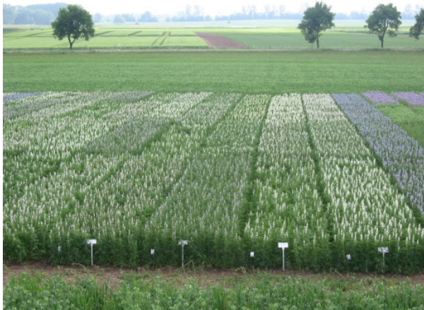
Lupinensortenversuch, Standort Gülzow

Auf besseren Böden mit Ackerzahlen über 40 sollten vorzugsweise die endständigen Sorten angebaut werden. Sie reifen gleichmäßiger ab, so dass auch bei einer besseren Nährstoffnachlieferung und einem höheren Wasserhaltevermögen der Böden die Gefahr eines ungebremsten Wachstums nicht besteht. Ernteverzögerungen durch intensive Seitentriebbildung und Lager treten bei diesen Sorten in der Regel nicht auf. Die Ertragsunterschiede zwischen den Sortentypen sind auf diesen Standorten gering. Besonders Leistungsstark erwies sich in Feldversuchen die Sorte Boruta (Abb. 2).